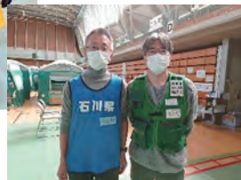
1.5次避難所へDWAT登録員としてテント割業務に従事しました