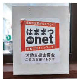
はままつna-netの募金活動として各施設に募金箱を設置しています