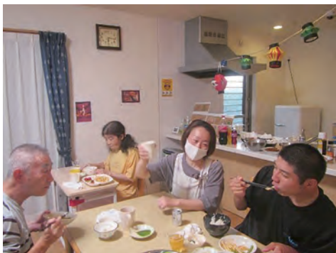
ホームイベントの居酒屋温心寮♪

先にも触れましたが、介護保険認定を受けることが可能という事は、選択肢が広がるという事です。個々の障がい像と機能低下の状態に合った場所を、障害福祉サービス・介護保険サービスの両方から探していくのです。