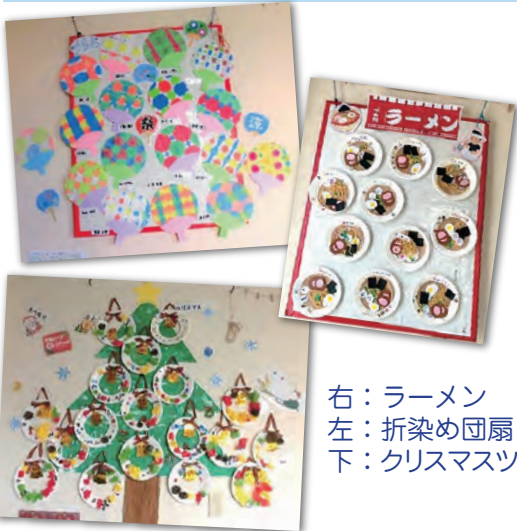
右：ラーメン 左：折染め団扇 下：クリスマスツリー

夏休みには、アンサンブル江之島の元浴場にて水遊び（今年度は中止）をしたり、ハロウィンには隣の店の方と交流したり、クリスマス会には、サンタが来てくれたりと様々な活動に取り組んでいます。