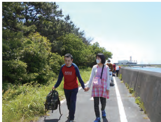
～ 馬込川の河辺を散歩するのも今年度で終わり ～