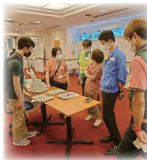
配食作業を公助から共助へ移行の打ち合わせ

主訴は健康悪化や避難生活の苦勞、今後の暮らしへの不安などの声が多く、それらの課題を多職種で共有し、必要な情報は行政にも伝達していきましました。 またDWAATとして、健康体操の実施・段ボールベッド設置・部屋への配食作業・医療機関の付添などもさせていただきました。