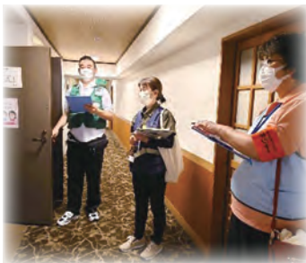
他職種チームで各部屋へ聞き取り調査に

私が現地入りしたのは発災から2週間余が経ち、19日に前避難所であったホテルから移動して間もない時期。高齢者・基礎疾患を有する方・障がい者等、配慮を必要とする方のお部屋に伺い、健康状況や避難生活のお困り事を聞かせてもらいました。