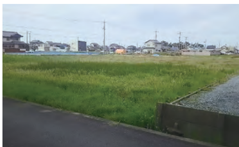
～ 整備用地 ～

以上のことを念頭に土地探しから始め、各方面からの協力を仰ぎ、何件もの物件情報の提供を頂きましたが、地主の方の都合や立地条件・法的制限等により候補地として決定するには至らず、途方に暮れる日々を送りました。そのような時、南区の民生委員の方より現整備用地の情報を頂き、地主の方に直接お会いして事情を説明したところ「使っていない土地なので福祉事業のために使用