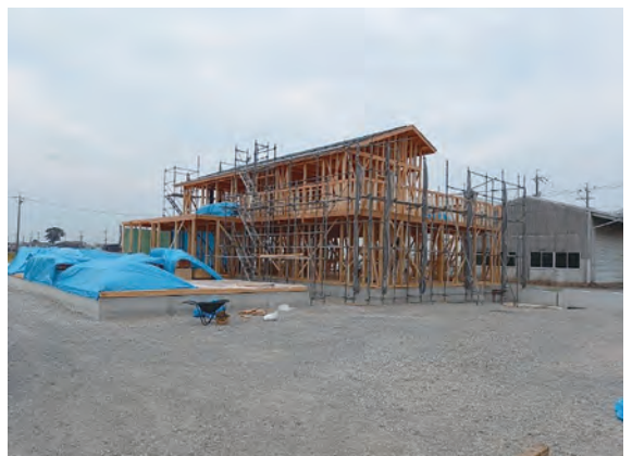
～ 9月初旬 棟上げされました。～

アンサンブル江之島から新しい建物までの距離は5km弱。時間としては自動車でも10分かかります。場所の変更で利用者の自宅より近くなる方遠くなる方が当然いらっしゃいます。従って送迎の時間やコースが変わってきます。活動については散歩やペトボトルキャップ選別作業のエコワークを中心に利用者に合わせて活動を引き続き提供していきます。らっ