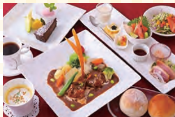
本格的なフレンチコースを介護食で

テイクアウトも充実していて、今の時期にも安心!非日常を味わえる空間、コロナが落ち着いたらみなさんも足を運んでみてはいかがでしょうか。