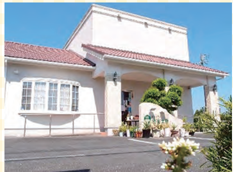
玄関前ガーデニングもかわいいですよ