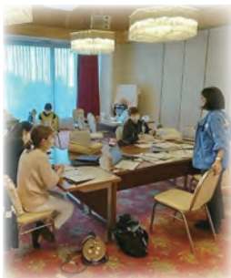
毎朝ミーティングを実施 避難者の状況把握に努める

DWAATの派遣は8月末までと正式に決まり、健康体操も終了となるので、「あと1週間しかないから来て欲しい」「あと1週間で終わるから、ご本人の希望通りでいいのか」と悩みながら毎日お部屋へお迎えに行きましたが、ドアをノックする音や呼びかけも聞こえない様でお会いすることができませんでした。コロナ禍でなければ、近くで大きな声で説明できたのに…と残念な思いで4日間の支援を終りました。