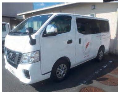
新しい車に 子供達も大満足！

静岡県共同募金会様、地域の皆 さまのお支えに感謝し、大切に使 わせていただきます。