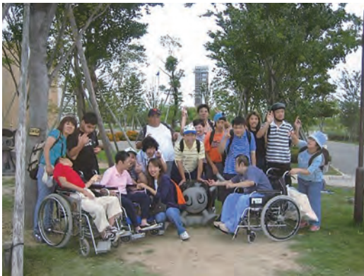
～ 開設当初 ～

マルカートは15年前、小羊デザインホームの事業展開の中で南エリアに事業所を分けたいとの願いから重知的障がい者が通所できる拠点としてアンサンブル江之島内で事業を