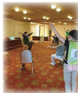
健康体操は避難生活の不活化予防に重要

健康体操に参加されていた99歳の方が、「耳が遠くて説明が聞こえない。みんなの動きについていけないから明日から参加しない」と言っていたという報告がリハビリチームからありました。