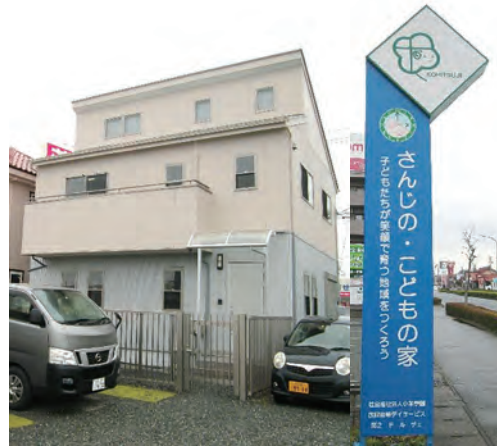
右：施設外観 左：玄関掲示の様子