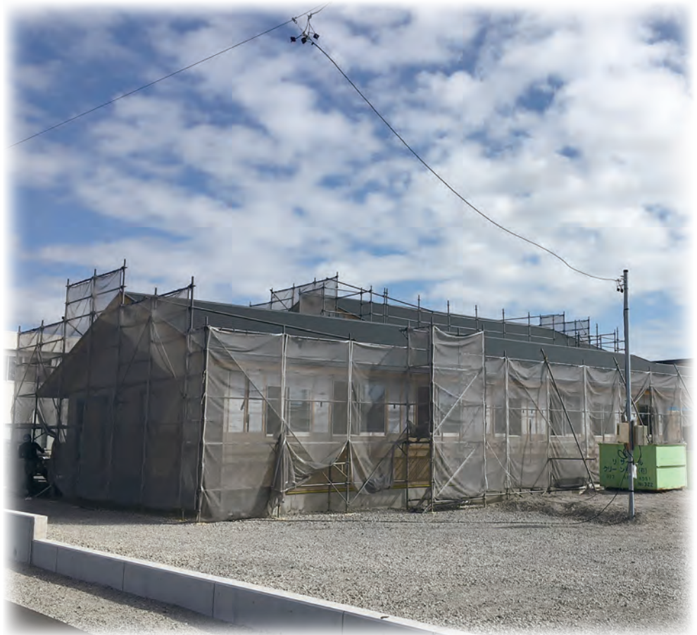
南エリアのマルカート・ドルチェ ～南区新橋町に移転建設中です～

小羊学園は55年前、知的障がい児の入所施設として開園し、その後成人入所施設を開設し事業展開した。入所施設に入所される方たちは、生活拠点が地元から施設に移り、地域から離れがちだ。一方、自宅や地元地域で生活しながら、日中活動のために利用するのが通所施設である。小羊学園では、小羊デイケアホームがその第1号である。その後、毎日通所するための地理的な不便さを多少なりとも解消するために、浜松市の南エリアに新たに開設したのがマルカート（ドルチェ）である。